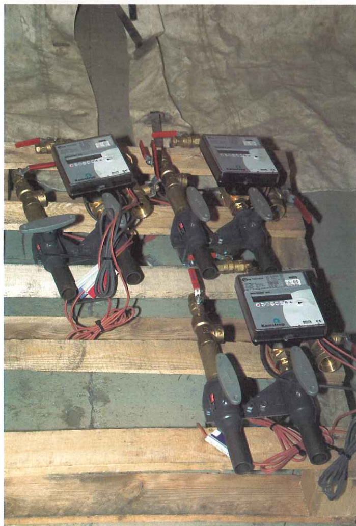
Spesialproduserte komponenter for Lyse Energi.

store i bransjen, og kan lett bli større. Men vil de det?